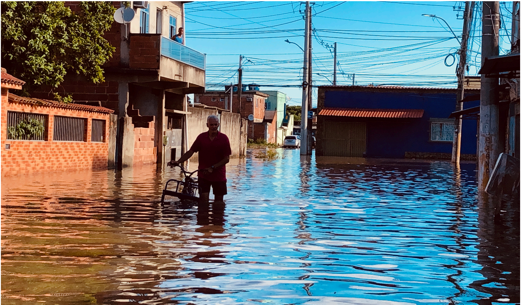
Em janeiro, chuvas intensas provocaram alagamentos em diversos bairros e municípios do estado, expondo o racismo ambiental

zadas. Para promover mudanças significativas nessas áreas, é essencial usar o termo racismo ambiental, porque é crucial entender que, a realidade das questões climáticas vai além de meros desastres naturais.